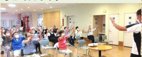
昨年の総会(オープニングの健康体操)

1年間の活動を振り返り、今年度の方針や予算、役員を確認します。たたら香椎支部の会員はどなたでも参加頂けます。