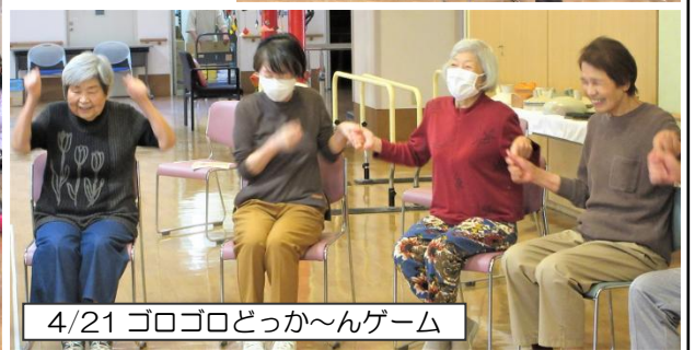
4/21 ゴロゴロどっか〜んゲーム