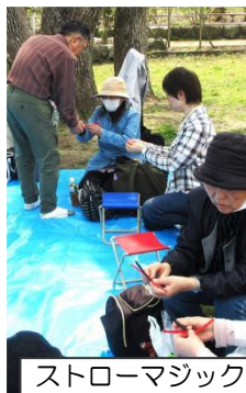
ストローマジックを指南