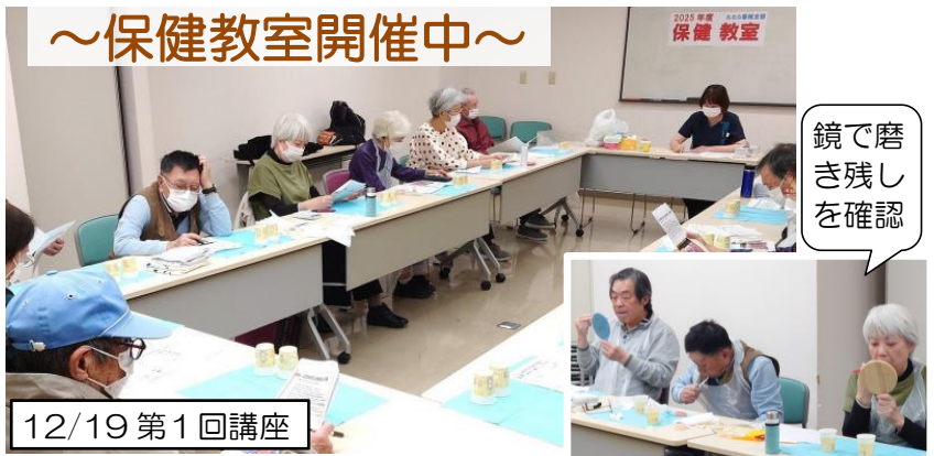
鏡で磨き残しを確認