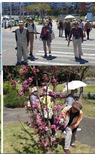
「まあキレイ！」と見とれています