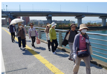
橋を渡ると心地良い潮風に足をとめたくります

ウォーキング班では、ウォークラリーに登録されている方を中心に呼びかけて、4月13日（土）にウォーキングを開催しました。当日は春の陽ざしが心地よく注ぐ中12名が参加。香椎浜からアイランドシティに向けて海辺を眺めたり、道端の草花を楽しみながら思い思いに散策しました。途中、公園の日陰で「お菓子タイム」を取ると、ますます元気が出てきて、楽しく元気に歩くことができました。