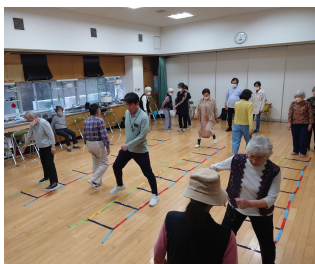
楽しくのびのび良い汗をかいています（写真上下）

毎月第3月曜はフィットネスの班会です。足腰の筋力低下予防のトレーニングや、脳トレになるラダー（はしごを使う運動）に取り組んでいます。3月から文化祭に向けたダンスの練習も行いました。