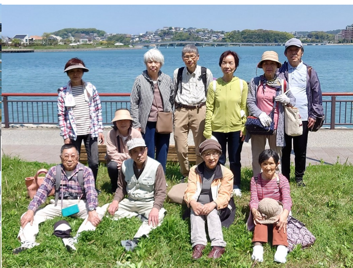
「気分も最高です！」と参加の皆さん