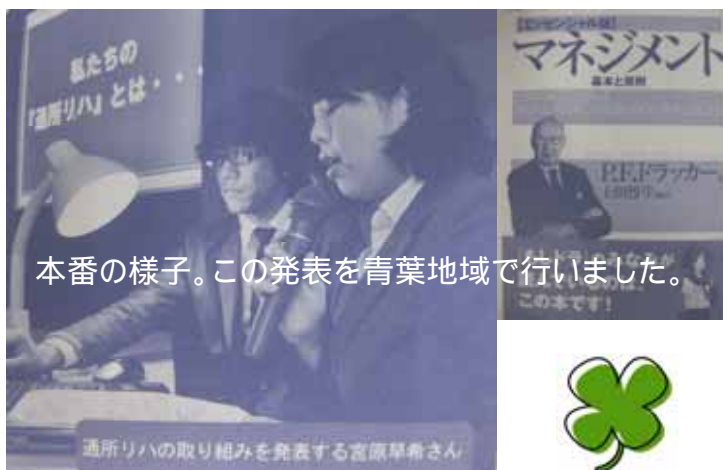
本番の様子。この発表を青葉地域で行いました。