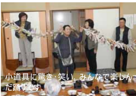
小道具に驚き・笑い。みんなで楽しんだ踊りです。