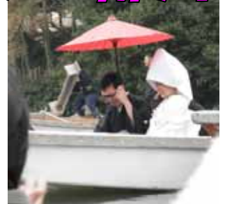
めったに見れないよ。との事