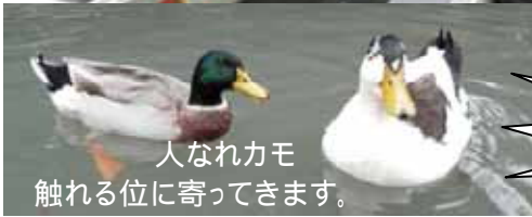
人なれカモ 触れる位に寄ってきます。