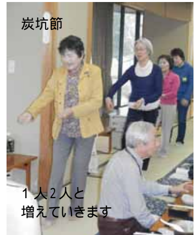
炭坑節 1人2人と 増えていきます

11月2日、曇空の中、川下りで有名な柳川へ51人で日帰りバスハイクへ行って来ました。西鉄土井営業所でバスに乗り込み、病院前で職員に見送られ、いざ柳川へ出発。今回は、みなさんに楽しんでいただく準備段階から頑張りました。そのかいあり、会員で初参加や入会しての参加と新しい顔ぶれが加わりました。道中では、芸達者な参加者による手品やクイズで楽しく移動です。途中、渋滞もありましたが、みなさんの日頃の行いが良いためか予定通り到着。川下り時間の関係もあり、早速、昼食交流会の開催です。豪華な食事をいただき、参加者の手品・歌と腕前を披露しました。終わりころには炭坑節や小道具ありの踊りで、驚き・笑いありと楽しいひと時となりました。そして、次の楽しみ川下りへ。参加者全員で舟3隻に乗り込み、70分間の情緒ある景色と船頭さんの話しを楽しみました。この日は、なかなかお目にかかる事のない「舟にのっ乗った花嫁」をみる事ができ、みなさんも幸せな気分となりました。帰りは道の駅みやまに立ち寄り各々買い物と、みなさん満足の笑顔で帰ってきました。